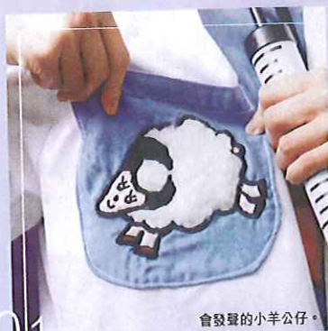
會發聲的小羊公仔。