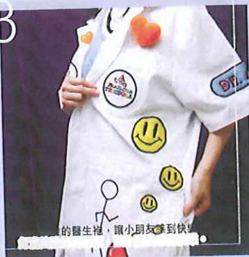
快樂的醫生袍，讓小朋友感到快樂。