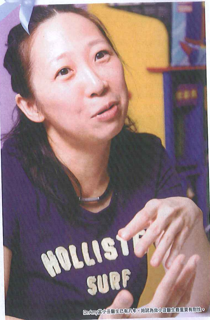
Dr. Amy當小丑醫生已有八年，她認為做小丑醫生最重要有耐性。