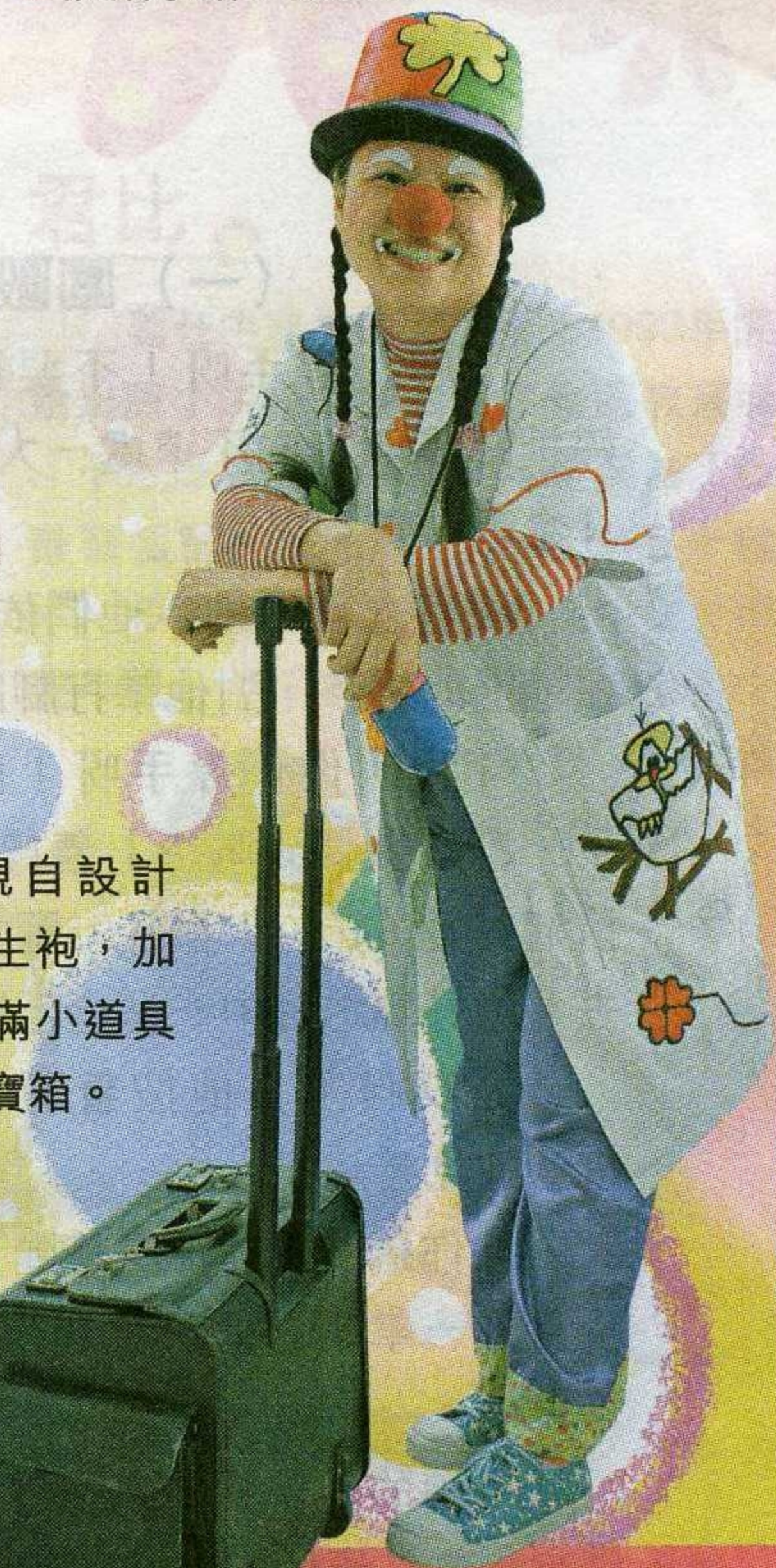
● 親自設計的醫生袍，加上裝滿小道具的百寶箱。