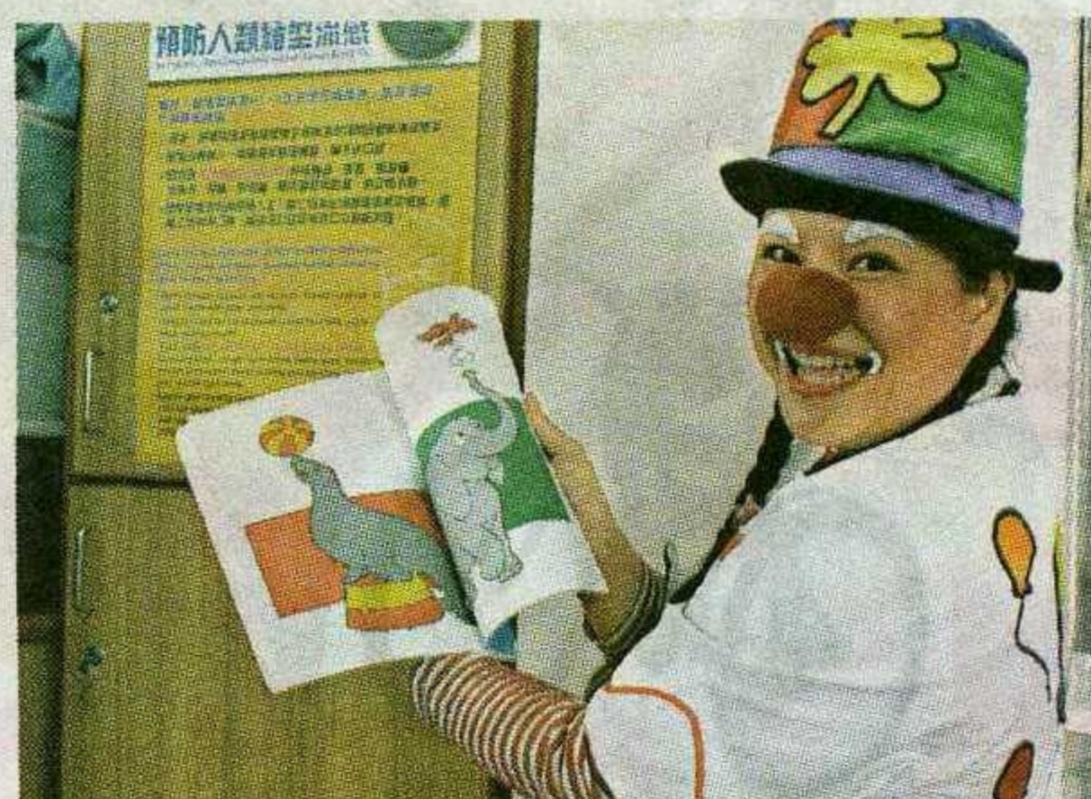
● 說故事給小朋友聽。