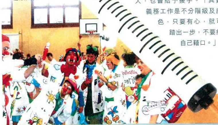
每兩年各地的小丑醫生都會聚集在瑞士進行集訓。

此外，她又認為如果一件事，理念正確又可以幫助人，別人就會認同該理念，那怕是一些與你並不相識的人，也會給予援手。「其實義務工作是不分階級及膚色，只要有心，就可踏出一步，不要給自己藉口。」